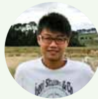
周钟 总承包事业部