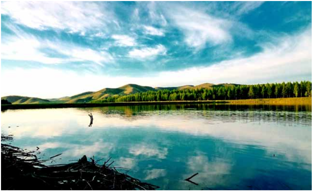
《塞罕坝神龙潭》六合天融公司 孟璐