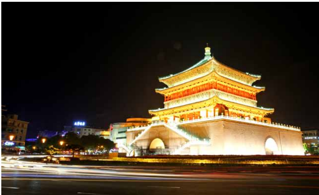
《西安钟楼夜色》太阳能公司 赵雷