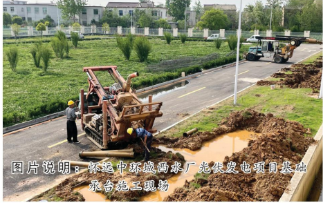
图片说明：怀远中环城西水厂光伏发电项目基础联合施工现场

家“双碳”目标，以实际行动践行了“绿水青山就是金山银山”的发展理念，用“水务蓝”赋能“生态绿”。在未来，怀远中环将继续当好能源清洁低碳转型的引领者、推动者、先行者，助力中环经济绿色、可持续发展，为实现“碳达峰”“碳中和”目标贡献力量。（怀远中环 吴梦）