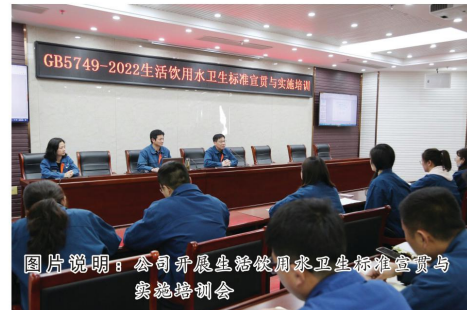
图片说明：公司开展生活饮用水卫生标准宣贯与实施培训会

下一步，公司将全面贯彻落实新的《生活饮用水卫生标准》（GB5749-2022），严格按照新国标要求，进一步加强水质检测能力建设、落实各项处理及管网响应应对措施、建立健全相关管理办法，确保市民用上合格水、放心水。（武子萍）