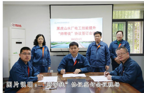
图片说明：“拜师学艺”协议签约仪式现场

为进一步促进青年职工的快速成长，培养“一专多能”的电气技术骨干，深入了解维修电工的工作职责、操作规程，落实公司安全生产职责，人力资源部经公司领导批准，根据黑虎山水厂提出《电工岗位技能再提升计划》的申请，于3月31日在黑虎山水厂举行了2023年蚌埠中环水务有限公司第四批“拜师学艺”师徒合同签订仪式。