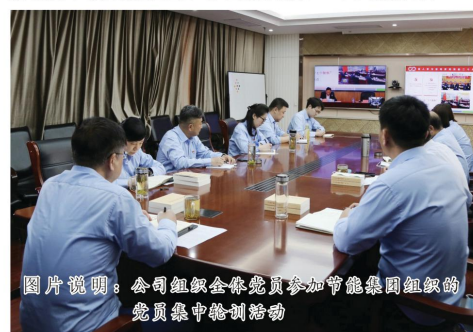
图片说明：公司组织全体党员参加节能集团组织的党员集中培训活动