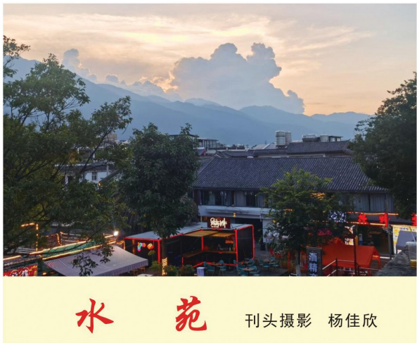
水苑 刊头摄影 杨佳欣

我每次路过这里，面对这些“横着活”的竹子，总是心生崇敬之情。我默默地问候着它们，竹子如人，我相信它们一定会听到的。如今，这片竹林经过几场严冬的洗礼，已是苍翠欲滴、蝴蝶纷飞了。可我仍记得那么一些竹子，它们的灵魂是高高站起的，这些“横着活”的竹子，精神不倒，永远活在人们仰视的心中。