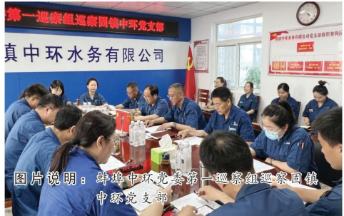
图片说明：蚌埠中环党委第一巡察组巡察固镇中环党支部