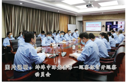
图片说明：蚌埠中环党委第一巡察组召开巡察动员会

王厂长接到电话后，意识到问题的严重性，第一时间放下手中工作，带领五个电钳工赶到回收塘旁。现场查看后，王厂长二话没说直接跳入泥塘，一点点摸索着污泥泵进行徒手清理。由于污泥泵出现故障，无法第一时间找到泵体的准确位置，于是王厂长立即指挥其他职工安排人到现场。水管到位后，王厂长先把把硬的污泥冲散开，经过一段时间后，较硬的污泥终于被冲散，王厂长也通过摸排找到了污泥泵的准确位置。（申雷雷）