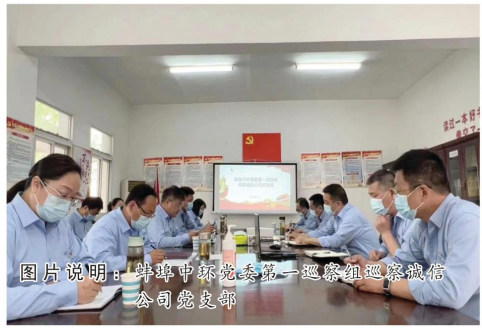
图片说明：蚌埠中环党委第一巡察组巡察诚信公司党支部