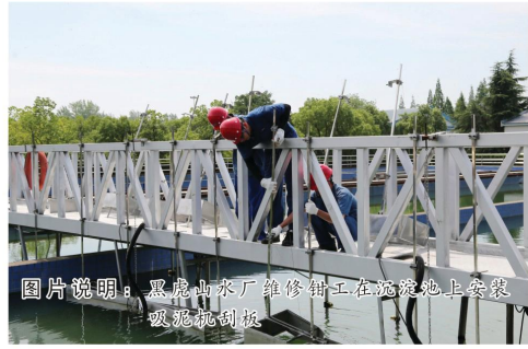
图片说明：黑虎山水厂维修钳工在施泥池上安装吸泥泵铜板

最后王强书记强调，在封闭运行期间，调整好心态，坚定信心，封闭运行的时光仿佛是阔别已久的校园，当回首往事时，不因虚度年华而悔恨，也不因碌碌无为而羞愧！年轻人要扛起央企的使命和责任。待到平安蚌埠时，你在岗位笑。（赵广运）