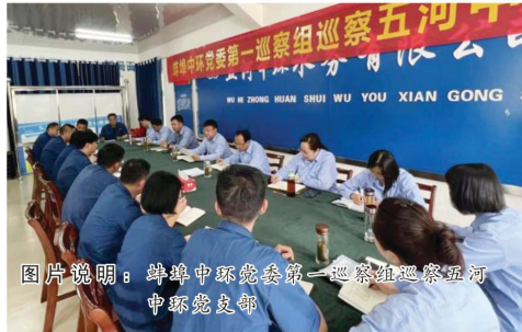
图片说明：蚌埠中环党委第一巡察组巡察五河中环党支部

蚌埠中环党委自巡察小组成立以来，在实践中牢牢抓住“问题”核心，提炼总结工作经验，以巡察整改为契机，找准巡察角度的切入点和着力点，充分发挥巡察监督的作用；推动上下联动，突出问题抓重点，紧扣主要找要点，拧紧整改“加压阀”；通过问题反馈、交流，实现与被巡察单位之间同题共答、同向发力、同求实效，推动巡察整改走深走实，共同将问题整改落到实处；通过举一反三三整改、推动改革促发展，以实现全方位整改为目标，切实高效地推动供水事业高质量发展。（杨丽娜）