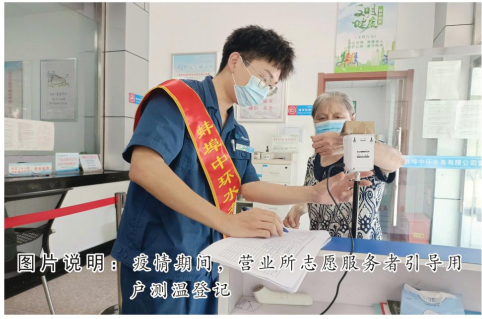
图片说明：疫情期间，营业所志愿服务者引导用户测体温