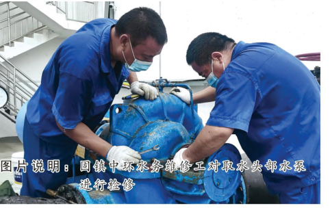
图片说明：固镇中环水务维修工对取水头部球阀进行检修

慰问百分百有力。面对复杂严峻的疫情防控形势，社区工作者始终战斗在群防群控、抗击疫情的第一道防线”。从全民核酸检测，到各种信息排查，再到封控、管控区的管理以及为居民生活物资的采购、配送，到处都是他们日夜奔波忙碌的身影。固镇中环党支部迅速响应、积极行动，主动对接社区，第一时间组织党员干部开展系列慰问活动，积极筹措口罩、消毒液、酒精、方便面、矿泉水等抗疫物资，全力支持疫情防控工作。（何晨）