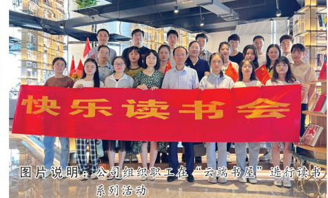
图片说明：公司组织职工在“云端书屋”进行读书系列活动。