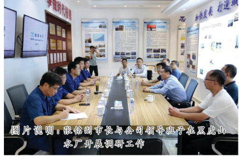
图片说明：张铭副市长与公司领导班子在黑虎山水厂开展调研工作。

2022年10月3日下午，蚌埠市副市长张铭一行在蚌埠中环水务党政工领导班子的陪同下莅临黑虎山水厂开展基层调研工作。党委书记、董事长王强及公司领导班子陪同检查。