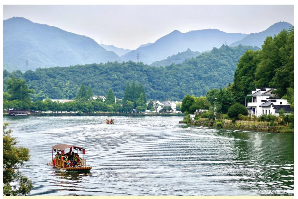
水苑 刊头摄影 王海荣

十二月，雪花飘舞，在这个寒风刺骨的季节里，不禁让人感受到了冬季的寒冷。刚看完《南京！南京！》的我也感受到了历史的沉重，就在1937年的12月13日这一天，南京保卫战爆发，这场血与火的战争撕开了一场血腥而惨烈的序幕。 那一天日军用炮火轰开了南京大门，灭绝人性的侵略者对手无寸铁的百姓，进行了长达六周惨绝人寰的大规模屠杀。这是一段血泪史、苦难史，更是一段屈辱史！面对日本侵略者们的疯狂进攻，中国军民用血肉之躯筑起了顽强的抵抗防线。他们用生命守护祖国的尊严和领土完整，谱写了一曲壮丽的抗战史诗。 我们不忘历史，牢记使命，铭刻刻骨铭心的苦难，过去的伤痛永远是我们的一本教科书。侵华日军当年在中国制造了种种恐怖言行，惨无人道，令人发指。面对暴行，中国人民不屈不挠，始终进行着殊死的抗争，英勇拼搏舍身救国。日本帝国主义的侵略和屠杀，以血的事实教育了人们，中华民族必须团结起来，面对列强不畏强暴，面对未来永远坚定向前。 在未来，我们要坚守信念和责任。南京保卫战中的英雄们无论面临何种困难和危险，始终坚守信念和责任。在今天，作为爱国青年，我们也应该坚守自己的信仰，勇往直前，以实际行动，承担起自己的责任。无论是在学业上还是在工作岗位上，我们都应该尽责，为国家的繁荣和社会的进步贡献自己的力量。