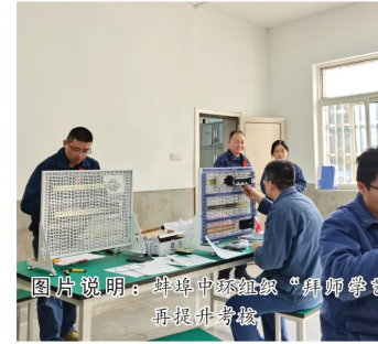
图片说明：蚌埠中环组织“导师带徒”电工技能再提升课程

下一步，蚌埠中环将持续常态化开展企业走访，坚持“企业的诉求在哪里，我们的服务就精准指向哪里”的服务理念，不断提升企业和群众“获得用水”的便利度、满意度，以高质量服务助推全市营商环境持续提升。（工程一处 邵一啸）