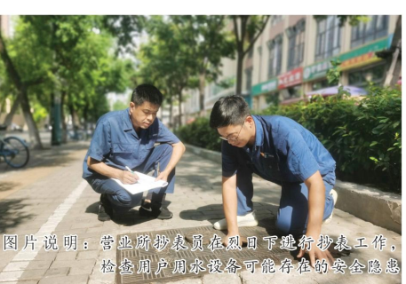
图片说明：管工班抄表员在烈日下进行抄表工作，检查户内漏水设备可能存在的安全隐患

黑虎山水厂将继续秉持“高点规划、高标准建设、高效能管理”的理念，全力推进智慧水厂二期建设，推动数字技术与供水业务的深度融合，实现全过程、可追溯的生产工艺可视化管理模式，为全面提升城市供水韧性、护航高品质供水服务提供强有力的支撑。 （黑虎山水厂 刘煜昱）