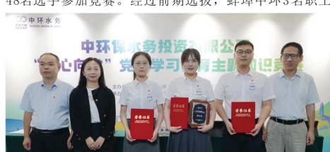
图片说明：蚌埠中环团委代表队在环中水务党纪学习教育主题知识竞赛中荣获第三名

为深入学习贯彻习近平新时代中国特色社会主义思想，全面落实公司党委对于青年党纪学习工作的指示要求，进一步提升团员青年精神素养水平，7月18日—20日，由中环水务团委主办的“同心向党”党纪学习教育主题团日活动在延安开展，来自中环水务所属单位各级团组织的青年们组成的16支代表队、共48名选手参加竞赛。经过前期选拔，蚌埠中环3名职工代表蚌埠中环团委参加此次竞赛。