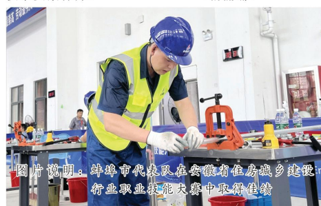
图片说明：蚌埠市代表队在安徽省住房城乡建设行业职业技能大赛中取得佳绩

蚌埠中环将以本届大赛为契机，持续深入开展岗位练兵、技能培训、师徒帮教等技能素质提升活动，激励更多职工走技能成才、技能强国之路，培养更多高素质、复合型技术技能人才队伍，为奋力谱写中国式现代化蚌埠做好供水要素保障。 （杨丽娜）