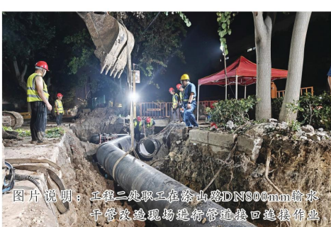
图片说明：工程二处职工在涂山路DN800mm供水干管改造现场进行管道接口连接作业

经过工程一处施工员高效有序地连夜奋战，地下障碍多、地形复杂、工程施工难度大等众多难题最终被克服。截至7月16日晚，已完成涂山路（纬四路一纬五路）改造供水管道700余米，且全段管网铺设未使用钢板桩，有效保障了今后供水管网的流速，更大降低了工程造价。随着蚌埠城市建设步伐不断加快，蚌埠中环坚持服务前置、主动作为，始终牢记企业使命，积极践行社会责任，全力保障供水安全，推进蚌埠市优化营商环境建设工作再上新台阶。 （工程一处 邵一啸）