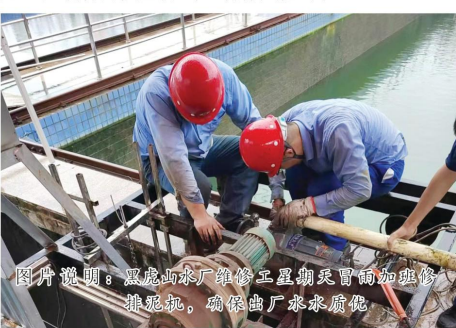
图片说明：黑虎山水厂管工班职工加班加点进行维修，确保出厂水质水质

5月中旬，蚌埠主城区淮河流域生态修复项目南岸席家沟至朝阳路路段开始施工，它是“靓淮河”工程的重要建设内容之一。施工现场挖掘机穿梭，建设正酣，但施工区域涉及至蚌埠市DN1200mm及淮上区席家沟过路DN600mm供水主干管，一旦损坏，将影响整个蚌埠市区供水安全。为此，管线所多措并举筑牢施工区域管网安全防线，确保风险可控。