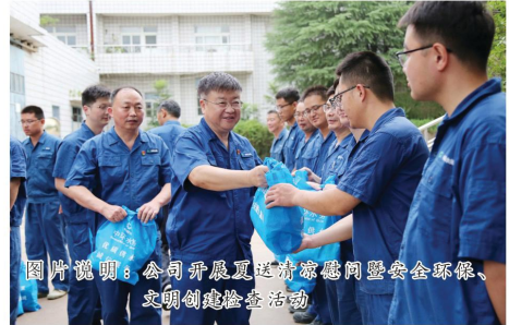
图片说明：公司开展送清凉慰问暨安全环保、文明创建检查活动

近日，蚌埠连续多日迎来高温天气，面对极端天气挑战，蚌埠中环一线职工依然坚守岗位，奋战在生产建设的第一线。为切实做好高温季节的防暑降温工作，关爱职工身体健康，同时加强安全管理，公司领导深入一线，开展送清凉慰问暨安全环保、文明创建检查活动。 自七月下旬开始，公司领导分别带队前往各基层单位，包括黑虎山水厂、管线管理所、施工部门以及各营业所等。在烈日炎炎的工地和忙碌的车间，领导们与一线职工亲切交流，详细了解他们的工作状况、生活需求以及高温劳动保护措施的执行情况。