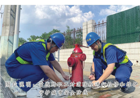
图片说明：管线所职工对消防栓进行检修和维护，守护城市安全防线

随着城市化发展的进一步提升，今年以来，市委、市政府对涂山路路段进行道路刷黑工程，由于该路段供水管道是禹会区与蚌山区的供水“主动脉”，且供水管网建设时间长、老化严重，不能满足周边商业及居民用水需求，蚌埠中环借此契机对该路段供水管网进行改造升级。此次改造使用的是DN800mm球墨铸铁管道，迁改全长约4400米。